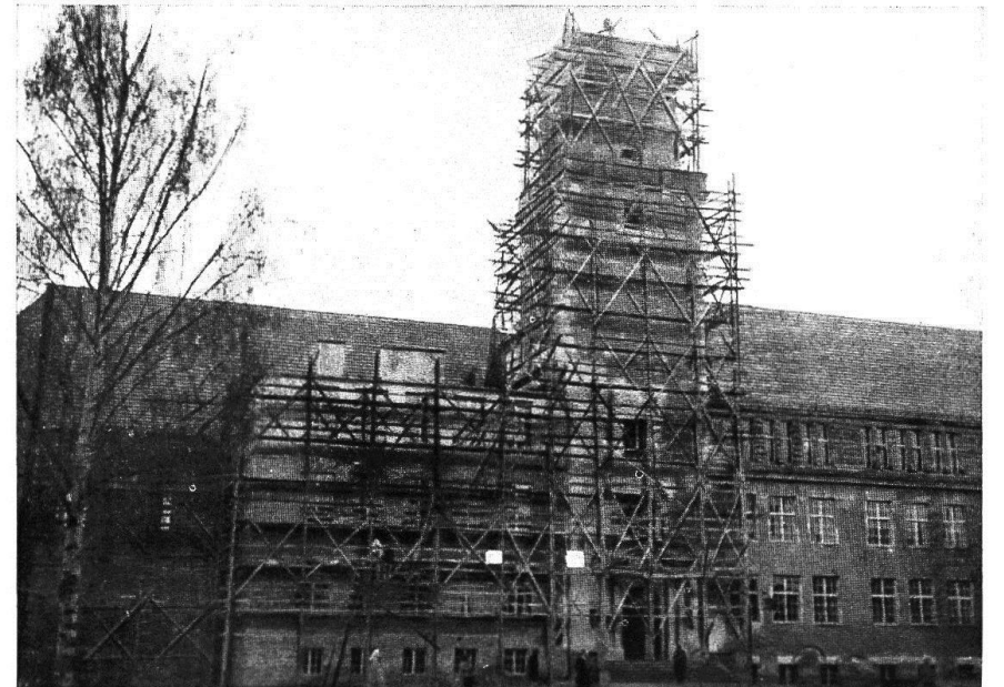
Letzte Putzarbeiten an der fertigen Straßenfront der Schule (Frühjahr 1950)