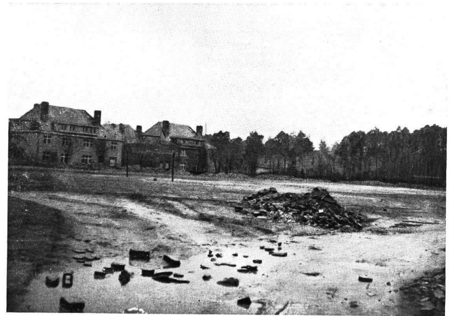
Die Spielwiese im Frühjahr 1950