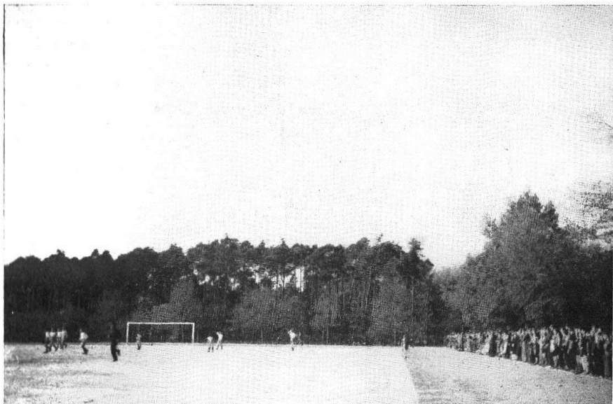
Das erste Spiel