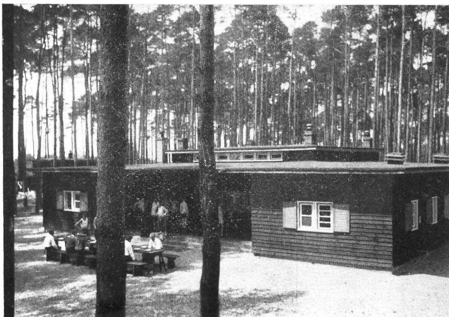
Unser liebes Heidehaus im Sonnenschein von einst

Der großen Politik geraten und wird dort einstweilen zerrieben. Was wird von ihm übrig bleiben? Nicht nur, daß es jetzt in der Ostzone liegt, also praktisch für westliche Jugendgruppen nicht erreichbar ist, es ist auch unserer Verfügung seit dem Zusammenbruch entzogen und völlig anderen Zwecken dienstbar gemacht.