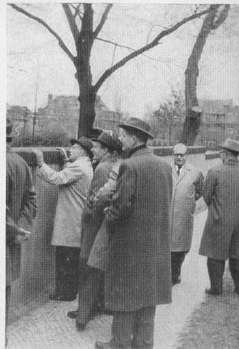
Blick auf den Pausenhof: