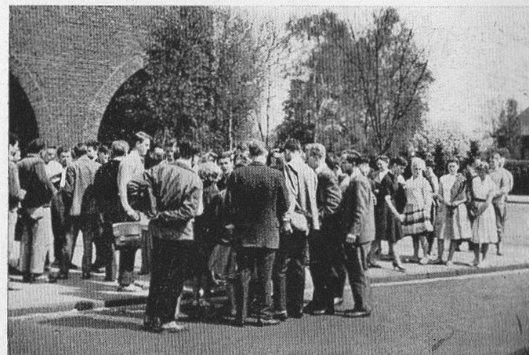
Die letzte Station: Gymnasium in Nordhorn