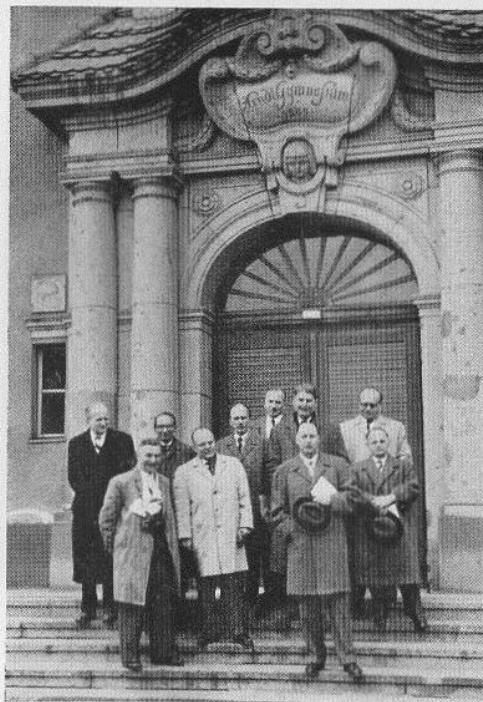
Zu: Es reißt nicht ab . . .

Soweit die Presse. Eine kleine Anerkennung soll der Klasse für das gutwillige und anstrengende Unternehmen doch noch zuteil werden: vier Bilder sind als Ergänzung hinzugefügt.