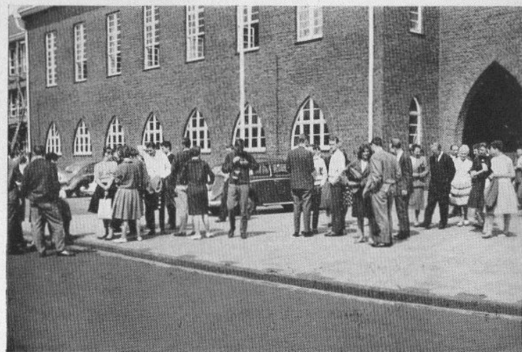
Beim Verlassen der Schule nach der Haupthandlung