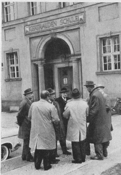
Nanu! Falsche Tür? Erinnerungsdrang?