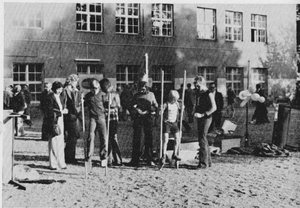
Dahlemer Tag 1976: Stelzengehen auf dem Schulhof.

...Ein Erlebnis werde ich, glaube ich, nie vergessen. Wir waren in der 9. Klasse,