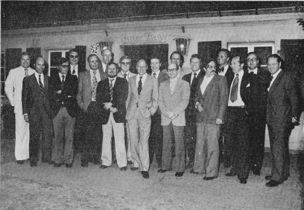
Vor dem „Alten Krug“ in Dahlem: Die Teilnehmer am Treffen der 12 o/g anlässlich ihres 25jährigen Abiturjubiläums.

manche Lehrer manchem von uns vom Studium abgeraten hatten, durchaus bewährte Kaufleute, Wissenschaftler, Juristen, Ingenieure, Lehrer und Ärzte gestellt hat, erstaunlicherweise jedoch keine Politiker. Wie sollte es auch anders sein, fiel doch unsere Ausbildung nach dem Abitur immer noch in die Zeit des Wiederaufbaus, wo Pragmatisches mehr im Vordergrund stand als teilweise unsinnige und nichts bringende Diskussion.