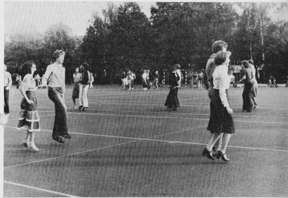
Dahlemer Tag 1976: Square Dance auf dem neuen Sportplatz.

Dies alles läßt sich freilich nach meiner Überzeugung mit Unterrichtsmethoden alten Stils schwerlich erreichen. Unser Schulverfassungsgesetz, so kritikwürdig es im einzelnen auch sein mag, trägt dieser Tatsache partiell Rechnung. Zwei Beispiele, die für die Unterrichtspraxis relevant sind, mögen dies veranschaulichen: das eine betrifft die Beteiligung der Schüler an der Planung und Gestaltung des Unterrichts. Dazu gehört auch wohl, daß der Lehrer die Kritik an sich und seinen Methoden nicht nur freigibt,