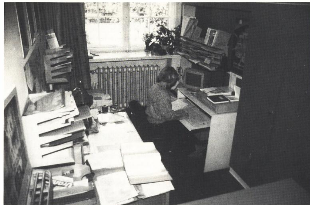
Das Schulbüro heute: Ohne Terminal, Speicher und Drucker geht gar nichts mehr.

Kontakte zum Arndt-Gymnasium, die es in den ersten Nachkriegsjahren gab, sind inzwischen ganz abgerissen, obwohl wir Prinz Bernhard regelmäßig mit den „Dahlemer Blättern“ versorgen. Vielleicht liegt es daran, daß der monarchische Gedanke aus den Köpfen jüngerer Arndter ganz geschwunden ist. Eine hübsche Geschichte, nun auch schon einige Jahre her, soll dies belegen: Die Redaktion bat den Schulleiter, eine Schulklasse in einer Freistunde mit der Beschriftung von Umschlägen für den Versand der „Blätter“ zu beauftragen. Zum Glück konnten wir es noch korrigieren: Auf dem für Prinz Bernhard bestimmten Umschlag stand in aller Kürze „Herrn Bernhard Prinz, Niederlande“. Sic transit gloria mundi. vth