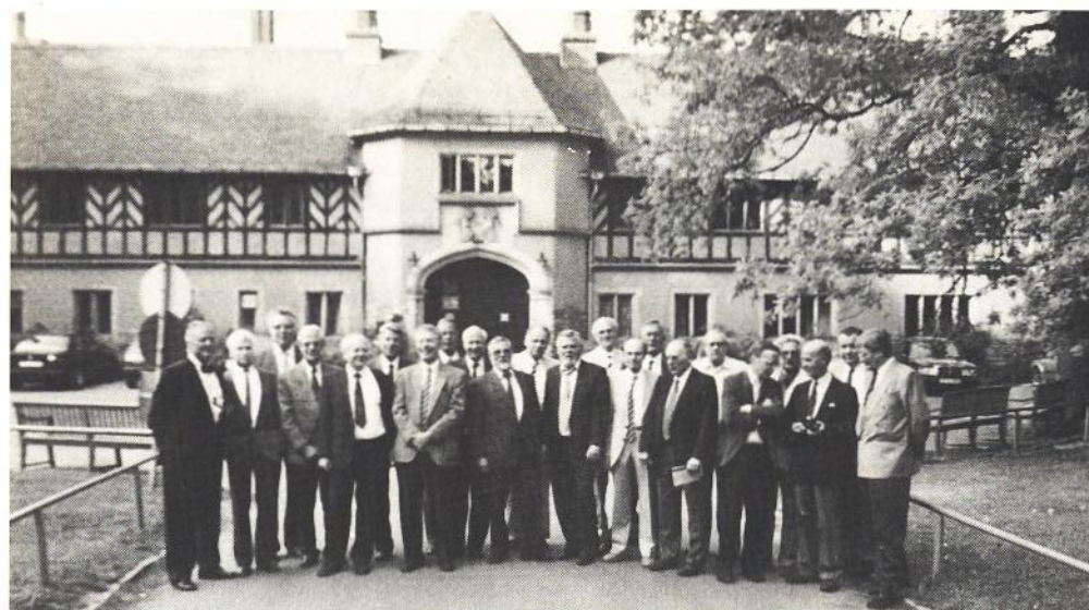
40 Jahre nach dem Abitur: Klassentreffen des Jahrgangs 1951 im Cecilienhof in Potsdam.

Ganz besonders gespannt war ich auf dieses Zusammentreffen der alten 51er Abiturienten, bedeutete es doch ein erstes Wiedersehen nach der langen Zeit von 40 Jahren! Warum das so war, muß ich doch etwas näher erklären. Ich war damals, Ostern 1950, aus einer DDR-Oberschule ins Arndt-Gymnasium gekommen, für eine verhältnismäßig kurze Zeit