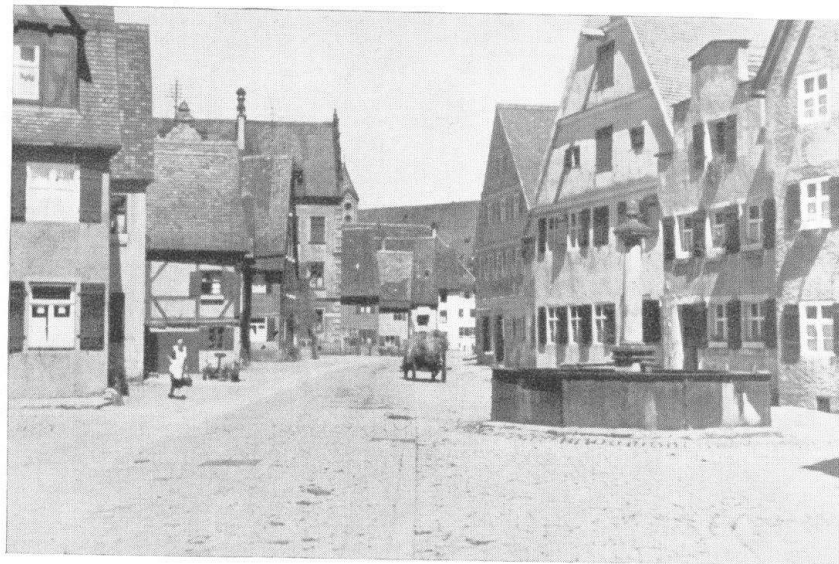
Die Nördlinger-Strasse in Dinkelsbühl (links vortrückende, rechts zurückweichende Siebelfronten).