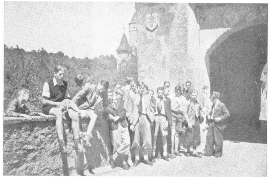
Klassenaufnahme am Geringer Tor in Dinkelsbühl.

Nürnberg war unser nächstes Ziel für 2 Tage. Wir erreichten es wie alle weiteren Orte im Omnibus, den wir uns von Bamberg aus gemietet hatten. Er trug uns ohne Murren und Reifenknall durchs schöne Frankenland. Die Reichsjugendherberge „Luginsland“ gehört zu den Gebäuden der Nürnberger Burg. Vor etwa 500 Jahren war das Haus unten ein Pferdestall und in den oberen Stockwerken ein Korn- und Futterspeicher. Unter treuer Wahrung des alten Charakters hat man das Gebäude dem neuen Zweck großartig erschlossen. Jetzt bietet es Unterkunft für 450 Jungen und Mädchen und ist immer voll besetzt. Was wir in Nürnberg alles sahen, kann ich hier nicht beschreiben. Das